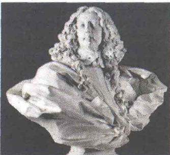
Bernini "Ritratto di Francesco I d'Este" 1650-1651