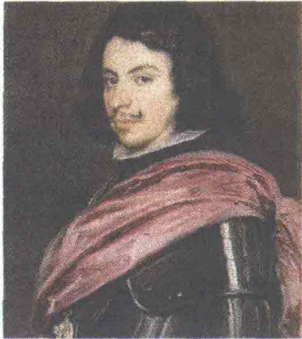
Velázquez "Ritratto di Francesco I d'Este" 1638-1639