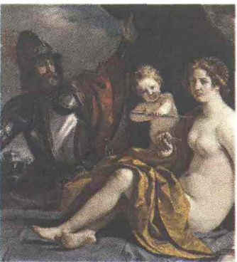
Guercino "Marte e Amore" 1633