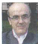
di STEFANO MARCHETTI

Dopo tre anni di chiusura, la nuova inaugurazione a Modena