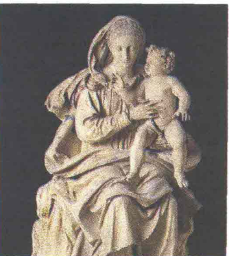
Antonio Begarelli "Madonna di San Salvatore" 1535 circa